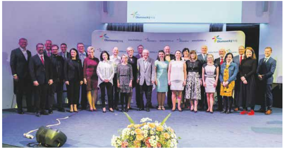
Vyhlašování nejlepších pedagogů se uskutečnilo v den narození J.A. Komenského.