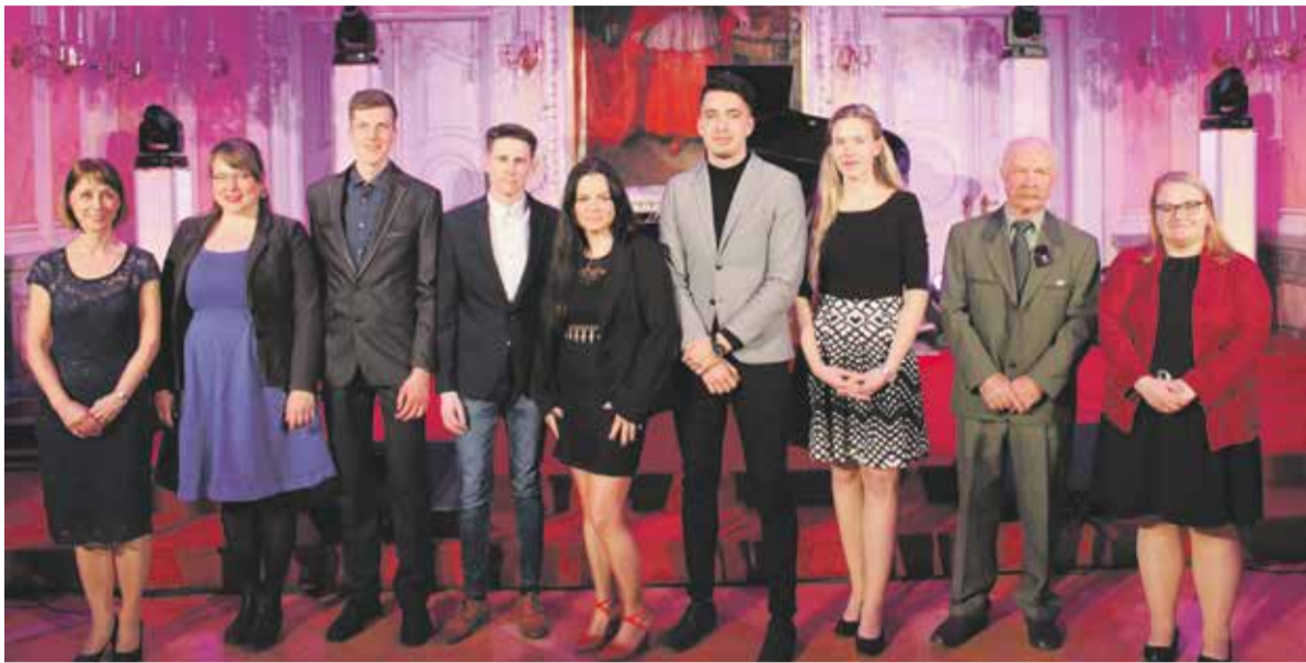
Ocenění Křesadlo 2021 si převzali nominovaní dobrovolníci v reprezentačních prostorách Arcibiskupského paláce v Olomouci.