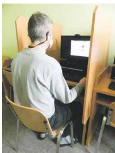
Kontaktní místo pro online návštěvy osob ve výkonu trestu je otevřeno každý pátek od 13:00 do 15:00 hodin na adrese Opletalova 1, Olomouc.

Už doba pandemie ukázala zvýšenou potřebu online komunikace ve vězeňství. Z důvodu zákazu osobních návštěv odsouzených přešla Vězeňská služba na skyповé hovory odsouzených s jejich blízkými. Mnoho rodin však nemá potřebné vybavení či znalosti, aby se mohly se svým blízkým spojit samy. Právě jim mohou posloužit kontaktní