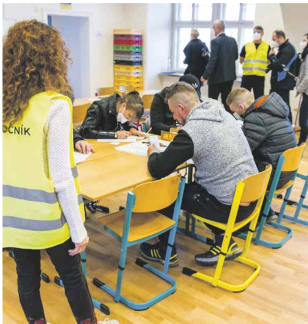
Asistenční centrum v Šumperku začalo uprchlíky z Ukrajiny přijímat 21. března.

Olomoucké asistenční centrum kvůli klesajícímu počtu uprchlíků upravilo na