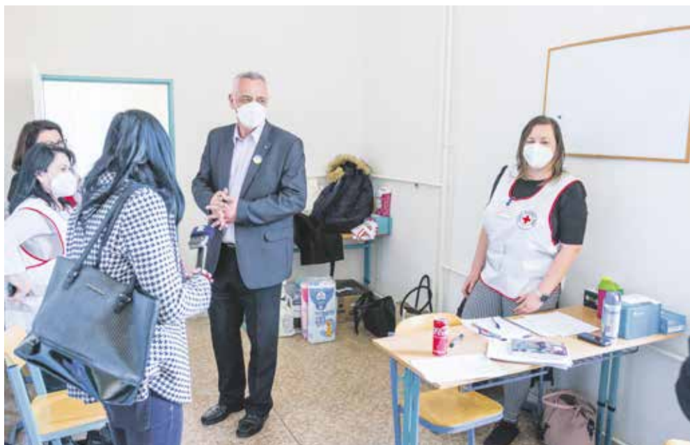
Šumperské centrum působí v budově krajské Střední školy řemesel.

O tolik korun navýšil Olomoucký kraj položku krizového řízení, aby lépe zvládl současnou uprchlickou krizi.