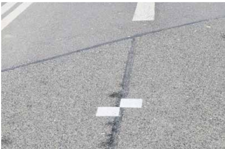
Bílé čtverce na komunikacích potřebují geodeti k vytvoření digitální technické mapy.