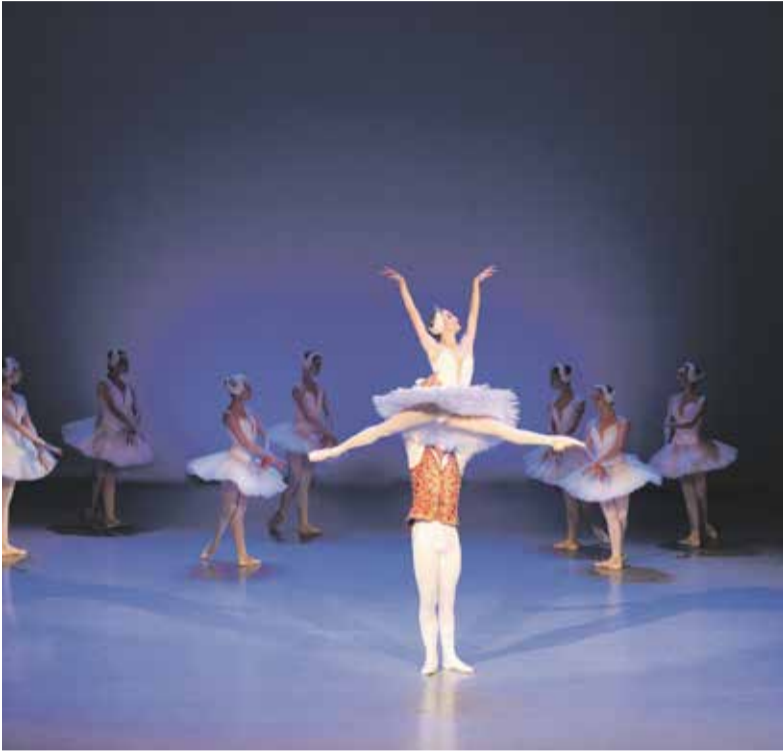
Městský balet v Kyjevě byl v době napadení Ukrajiny na turné ve Francii, domů se už dostat nemohou. Azyl členům poskytl Moravské divadlo Olomouc, s ubytováním souboru pomohlo hejtmanství.

Moravské divadlo Olomouc hostí od poloviny března členy Kyjevského městského baletu. Souboru, který se kvůli napadení Ukrajiny Ruskem nemohl vrátit z evropského turné domů, nabídlo vedení divadla umělecký azyl a možnost trénovat a zkoušet v budově divadla. Současně vznikl nápad uspořádat na olomouckém jevišti česko-ukrajinský galavečer. Během rekordně