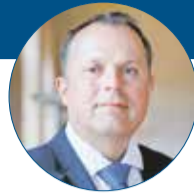
Martin Procházka, rektor Univerzity Palackého Olomouc

Univerzita Palackého se do pomoci uprchlíkům zapojila hned od prvních dnů. Naše Dobrovolnické centrum nyní pracuje s přibližně sedmi stovkami lidí, kteří nabízejí tlumočnické služby, psychologickou pomoc, právní poradenství, výuku češtiny, hlídání dětí a řadu dalších nezbytných činností. Od počátku jsou naši dobrovolníci jednou z hlavních součástí týmu KACPU, pomáhají ale i v rámci adaptačních skupin pro děti směřující do základních škol nebo se podílejí na péči o uprchlíky ve Fakultní nemocnici Olomouc. Vedle toho přijímáme studenty a akademiky z partnerských univerzit na Ukrajině a zapojujeme je do univerzitního života. Do této chvíle už zájem projevilo více než osm desítek lidí, někteří z nich už působí na našich fakultách. Řadu aktivit vyvíjejí i fakulty samotné, zejména v oblasti jazykového vzdělávání a volnočasových aktivit pro uprchlíky, zásadně tím přispívají k snadnějšímu začlenění dospělých i dětí z Ukrajiny do české společnosti.