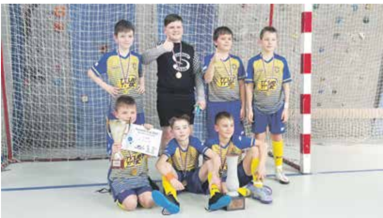
Hráči ze Žulové porazili tým ze Zlatých Hor 4:1. Podruhé v historii turnaje si odvezli putovní pohár.