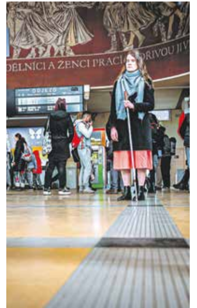
Cestování zrakově postižených má svá úskalí, o kterých ale olomoucké TyfloCentrum informuje nejen prostřednictvím workshopů, ale i videospotů.

TyfloCentrum Olomouc spustilo také dárcovskou výzvu na portálu Donio s cílem vybrat finance na podporu zaměstnávání zrakově postižených v Ergones – sociální firma, jejich rozvoj, vzdělání a zkvalitnění pracovního prostředí. „Uvědomujeme si, že je nynější doba složitá