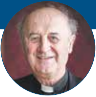
Jan Graubner arcibiskup olomoucký

Na farách a v dalších církevních budovách arcidiecéze našlo během prvního měsíce od vypuknutí války přístřeší na čtyři sta ukrajinských běženců. Další stovky získaly díky pomoci věřících ubytování v rodinách a na dvě stě uprchlíků využilo církevních kapacit krátkodobě, než se přesunuli jinam. Další pomoc nabídli věřící i jinak: na řadě míst se konají peněžní i hmotné sbírky, dobrovolníci nabízejí pomoc s vyřizováním dokladů a návštěvou úřadů, tlumočením, výukou češtiny nebo při hledání zaměstnání. A lidem prchajícím z Ukrajiny pochopitelně pomáhá také Arcidiecézní charita Olomouc.