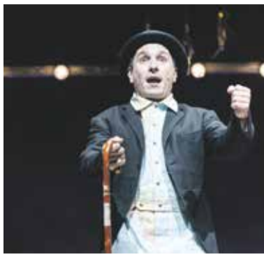
Představení Diktátor je inspirované Chaplinovým legendárním protiválečným filmem i moderní rakouskou a německou historií.

Pětadvacátý ročník láká kromě výjimečných představení také na unikátní atmosféru, jež každý den propojuje hostující umělce s divadelními příznivci