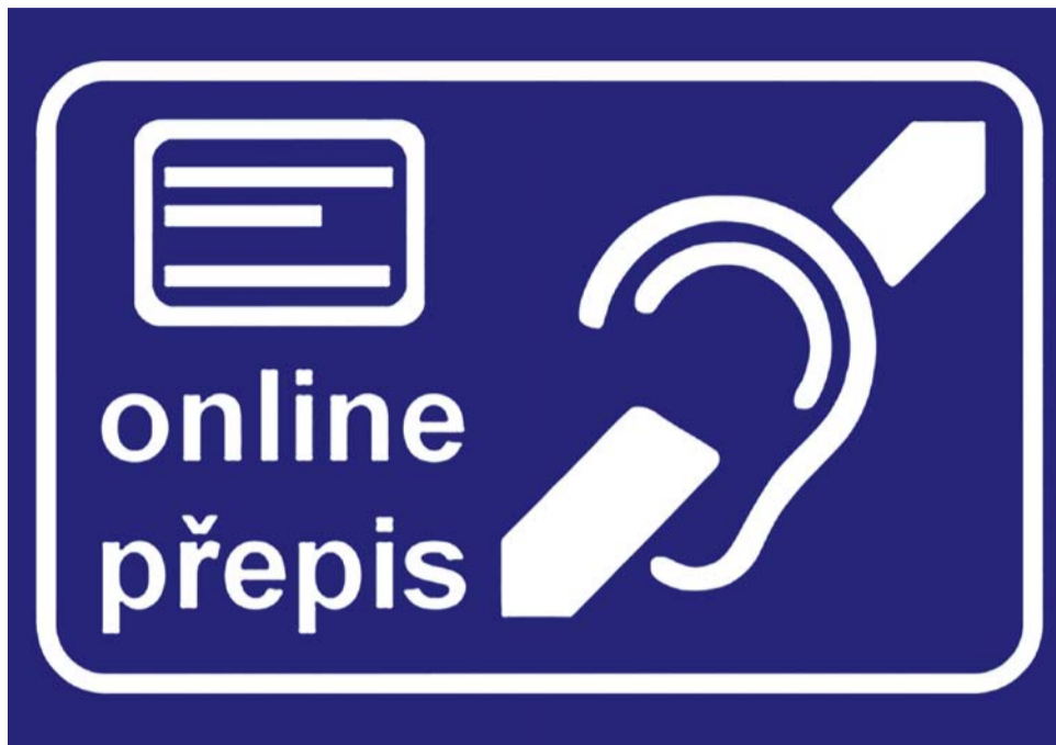
Kromě lidí s poruchou sluchu se bude speciální infolinka hodit i seniorům. Konverzace probíhá s využitím přepisovatele.

V praxi funguje infolinka pro sluchově hendikepované tak, že tazatel zadá prostřednictvím odkazu na webu KrajPomaha.cz svoje telefonní číslo, načež dojde ke spojení s přepisovatelem – ten pak zajistí