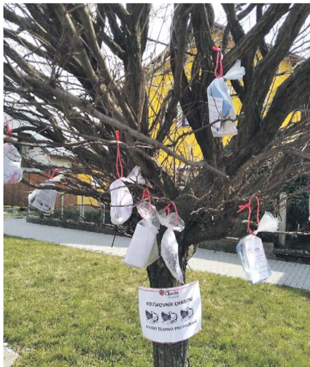
Rouškovník charitní. Látkové roušky nabízela šternberská charita mimo jiné rozvěšené na vybraných stromech a keřích.

Veřejnou sbírku pro pomoc postiženým občanům Litovelska, Uničovska, Šternberska vyhlásila Charita Šternberk. Velmi rychle tím reagovala na mimořádnou a krizovou situaci vyvolanou epidemií koronaviru covid 19. Shromážděné peníze jsou určeny zejména na přímou finanční pomoc jednotlivcům a rodinám. Konkrétně se jedná o potravinovou a hygienickou pomoc a pokrytí zvýšených výdajů organizace při řešení mimořádných situací (dezinfekce, ochranné pomůcky, pohonné hmoty, mzdové náklady za pracovní pohotovost). Stále je možné přispívat na účtu čís-