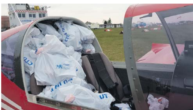
Ultralehká sportovní letadla zvládnout i menší náklad.

z Hranic. Lety pro roušky, respirátory nebo ochranné štíty umožní v krátké době dostat materiál tam, kde je třeba. (red)