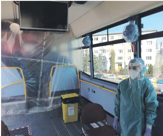
Krajský autobus se zdravotníkům hodil například při silném větru.

Víceúčelový krajský autobus, který má ve správě Koordinátor Integrovaného dopravního systému Olomouckého kraje, pomáhá zdravotníkům. Ve Fakultní nemocnici v Olomouci sloužil jako zázemí pro testování pacientů na nový druh koronaviru. „Provoz testovacího místa pod Teoretickými ústavami v prv-