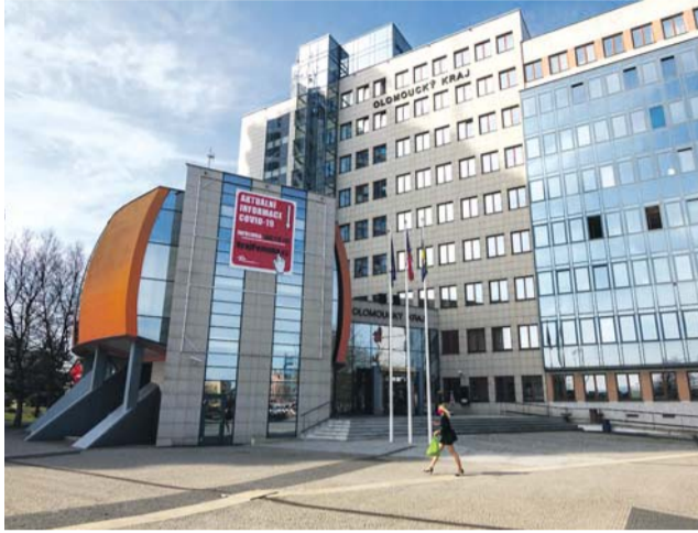
Třetinu předchozí ceny uspoří Olomoucký kraj na zemním plynu, u dodávky elektřiny to bude desetina.

43 milionů korun zlevní v následujících dvou letech dodávky energií pro Olomoucký kraj a jeho příspěvkové organizace. Krajský úřad v dubnu nakoupil 43 tisíc megawatthodin (MWh) elektřiny a 157 tisíc MWh zemního plynu na Českomoravské komoditní burze Kladno.