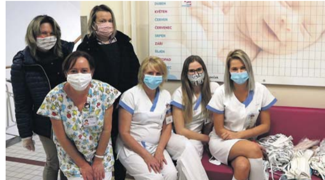
Když se nemohli starat o knihy a čtenáře, šli zaměstnanci Vědecké knihovny v Olomouci roušky. Některé předali Novorozeneckému oddělení Fakultní nemocnice Olomouc.

Knihy lze objednávat prostřednictvím on-line katalogu z domova a vracet by je měli čtenáři přednostně