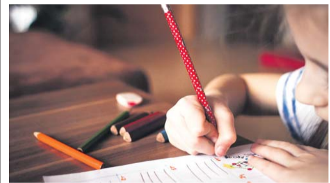
Minulý rok se olomouckému P-centru na podporu práce s rodinami podařilo vybrat ve veřejné sbírce přes sto tisíc korun.

Pomoc rodinám s dětmi se dlouhodobě potýká s nedostatkem financí, proto P-centrum otevírá nové kolo kampaně na zajištění finanční podpory pro tuto práci. Číslo účtu veřejné sbírky je 220888220/0300, přispět lze online na www.darujspravne.cz/sbirka/menime-zivoty-pomahame-lidem-na-olomoucku-v-tizivych-zivotnich-situacich . Cílem je pokrýt náklady spojené s provozem Rodinného centra U Mloka, kde se věnují ohroženým rodinám s dětmi a poskytují rodinné mediace. Sběrka je určena na technickou a materiálovou podporu, nehradí se z ní mzdy pracovníků. (red)