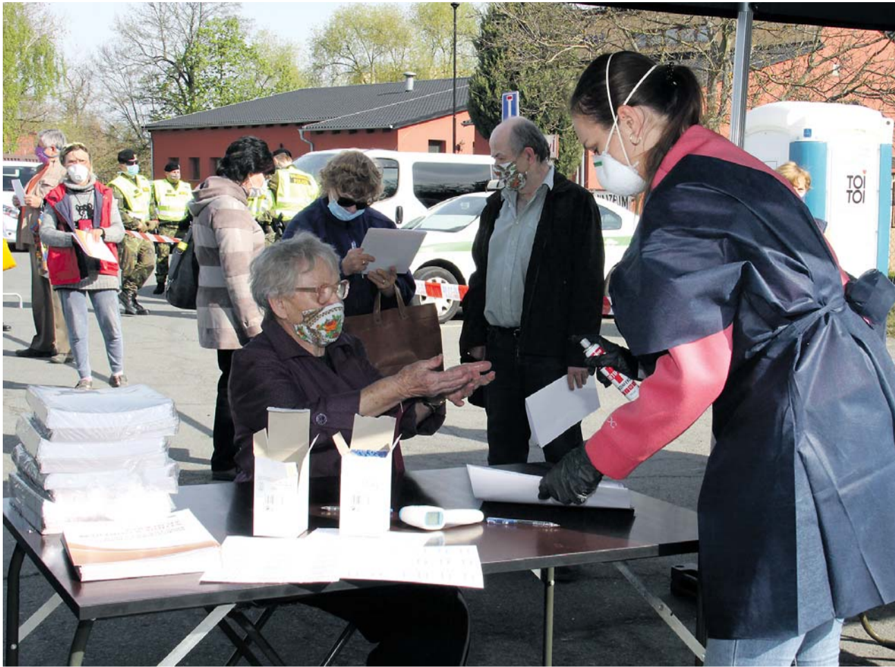
FOTO: Jak si kraj poradil s koronavirem