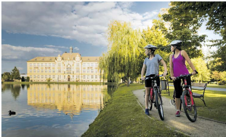
Nejvíce peněz na cyklostezky za poslední čtyři roky ukazuje, že kraji na cyklo dopravě záleží.

Hejtmanství nově upravilo dotační podmínky tak, aby na peníze dosáhlo více žadatelů. Jednodušší byla také administrace jejich žádostí. (red)