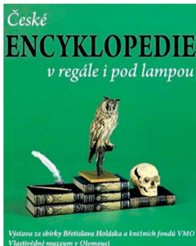
Kultura se pomalu vrací do normálního stavu. Vlastivědné muzeum v Olomouci věnuje první novou výstavu po svém znovuotevření českým encyklopediím.

Zájemci tak mohli a stále mohou zhlédnout fotografie a přečíst si zajímavosti například ke Kopí osudu, Voynichovu rukopisu, Turínskému plátnu či zjis-