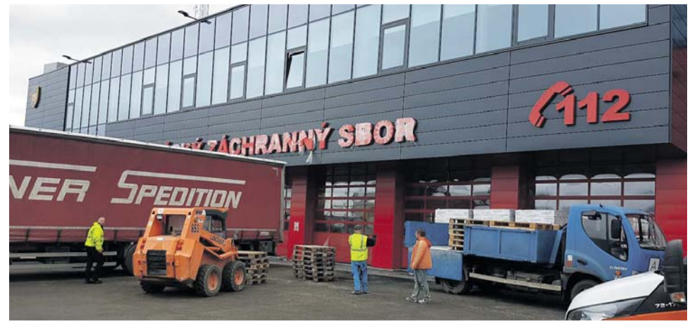
Moderní komplex za téměř čtvrt miliardy korun bude v sobě mít i cvičnou pětipodlažní věž.

Moderní komplex přinese prostorné garáže pro hasičské automobily. Místo současných sedmi výjezdových vrat jich bude k dispozici třiatdvacet. Součástí stanice bude plnohodnotný mycí box, strojní dílna s montážní jámou pro servis a opravy zásahových vozů. Nové zázemí získají