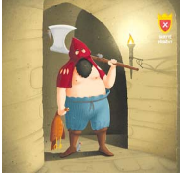
Nová aplikace věnovaná poutavé historii Jeseníka je ke stažení na Google Play nebo App Store.

Kat na čarodějnice, tak se jmenuje nová herní trasa v mobilní aplikaci Skryté příběhy, kterou připravilo pro své malé i velké návštěvníky město Jeseník. Díky ní se děti i dospělí ocitnou na zajímavých místech a zároveň se zábavnou formou ponoří do historie.