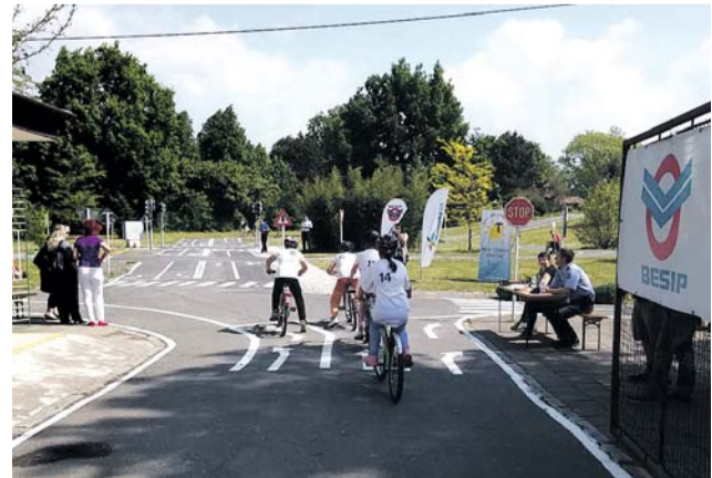
Úpravy cest i přístřešků na kola, nákup koloběžek nebo obnova dopravního značení. Letos dává hejtmanství na dětská dopravní hřiště přes 3,6 miliónů korun.

„Žádosti měst a obcí o poskytnutí dotace z krajského rozpočtu byly většinou zaměřeny jak na rekonstrukci dopravních hřišť, tak na pořízení nového vybavení. V jednom případě potřeboval žadatel finanční podporu na dokončení výstavby nového hřiště,“ doplnil Zahradníček. (red)