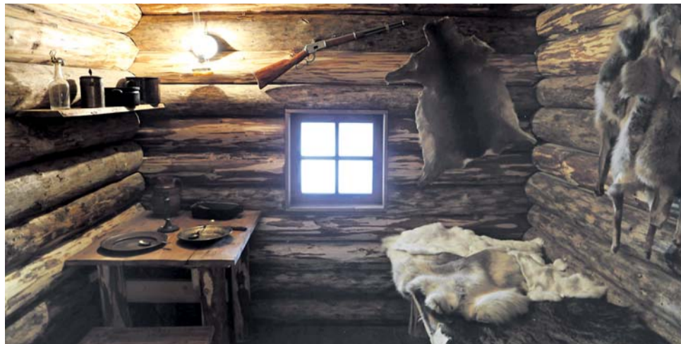
Na výstavě se podíváte do severského srubu nebo uvidíte dioráma Novosibiřských ostrovů.

Expozice přenesla návštěvníky na daleký mrazivý sever a představí obdivuhodný životní příběh obyčejného člověka, který se jen se čtyřmi krejčary v kapse vydal na cestu do neznámých končin. Vyprávění osudu J. E. Welzla začíná dobou dětství, mládí a prvními cestami po Evropě. Další části již sledují jeho putování Sibiří, život na Novosibiřských ostrovech i na zlatonosné Aljašce. Muzeum představuje také jeho „cestu“ do světa literatury.