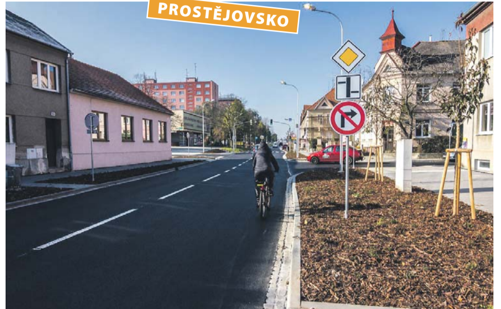
Do modernizace silnic na Prostějovsku půjde spolu s krajskými penězi přibližně 125 milionů korun. Přispějí ke větší bezpečnosti řidičů i příjemnější jízdě. Na snímku loni opravená Plumlovská ulice v Prostějově.

V případě Wolkerovy ulice se práce dotknou 300 metrů komunikace, kde bude vyměněna konstrukce celé vozovky. V lokalitě u křižovatky Wolkerovy s Tylovou ulicí se jízdní pruh rozšíří, aby zde