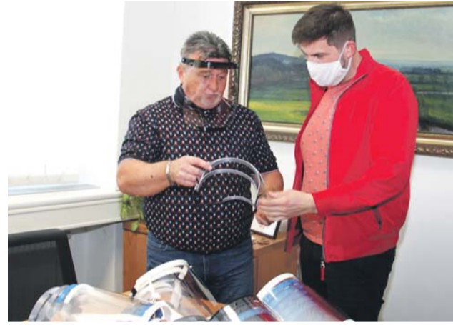
Štíty z olomoucké průmyslovky pomohly například v dětských domovech.

„Na 3D tiskárnách vyrábíme držáky, k nimž následně připevňujeme plexisklo. Tvorba jednoho držáku zabere asi devět hodin – kompletně štítu je pak otázkou pěti minut. Materiál nám pomáhají shánět i financovat rodiče našich studentů a také sponzoři,“ uvedl ře-