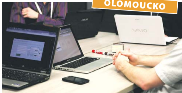
Smyslem mapování šikovných lidí je mimo jiné podpora lokální produkce.

Najít na jednom místě dárky pro své blízké, originální design bytu nebo kulturní program na večer umožní nově zveřejněná databáze. Obsahuje přes tisíc subjektů z Olomoucka. Seznam šikovných talentů zpracoval tým Univerzity Palackého v Olomouci za podpory města Olomouce.