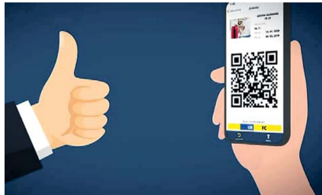
S jízdenkou IDSOK v aplikaci MobilOK můžete cestovat všemi dopravními prostředky objednanými Olomouckým krajem.

S jízdenkou IDSOK můžete cestovat všemi dopravními prostředky objednanými Olomouckým krajem, a to osobními a spěšnými vlaky, rychlíky a expresem Českých drah a.s., vlakem RegioJet, příměstskými autobusy a MHD v Šumperku, Zábřehu, Olomouci, Přerově, Prostějově a Hranicích. Jízdenky budete mít bezpečně pod kontrolou. Mobilní aplikaci lze instalovat na platformy Android (verze 5.0 nebo