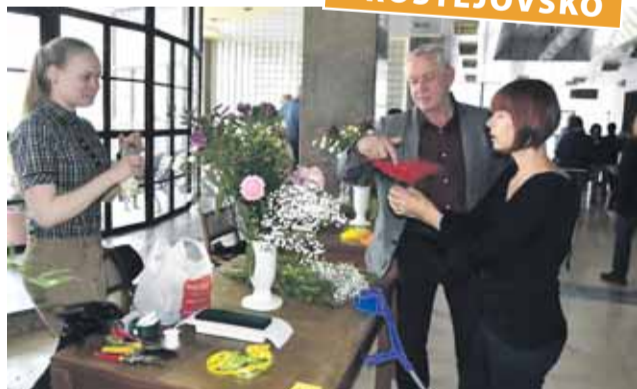
Tématem letošního ročníku byly Kulatá kytice do ruky a Kulatá vypichovaná miska.

Milovníci květin se na konci května sešli v prostějovském KaSCentru, kde se konal už 8. ročník Zemského kola Floristické soutěže. Slavnostního zahájení se ujala místopředsdkyně Českého zahrádkářského svazu Vlasta Ambrožová. Celkem se přihlásilo 35 účastníků, kteří soutěžili ve třech věkových kategoriích. Letošním tématem se staly Kulatá kytice do ruky a Kulatá vypichovaná miska.