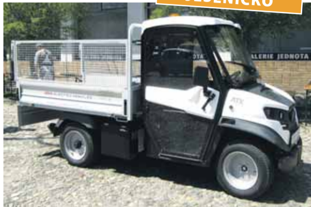
Elektromobil bude ve Vidnavě hlavně vozit odpad.