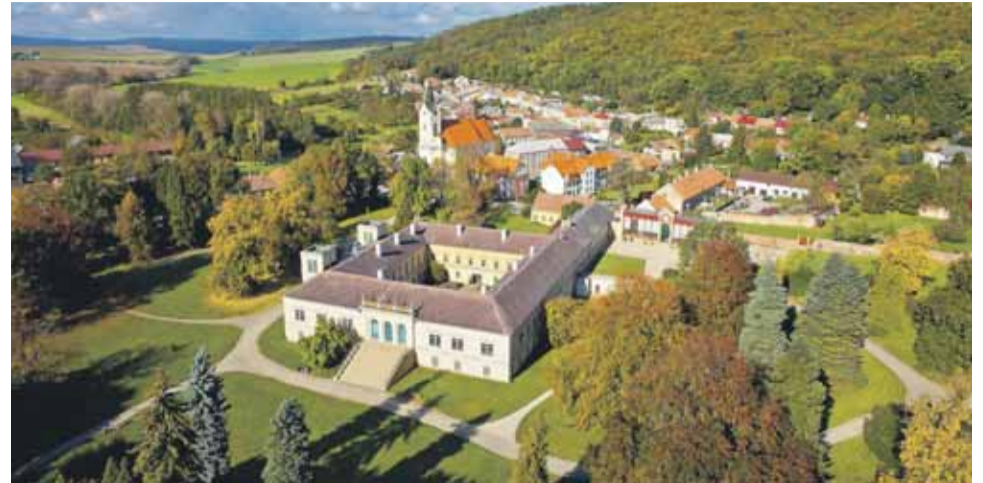
Do zámeckého areálu v Čechách pod Kosířem, jehož vlastníkem je Olomoucký kraj, minulou sezonu zavítalo na akce přes 44 tisíc návštěvníků.

V průměrném počtu strávených nocí zaujímá Olomoucký kraj v celore-