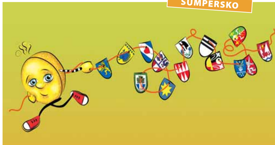
Soutěž Mohelnickem na kole je pro ty, kdo mají rádi tajemství, překvapení a luštění.