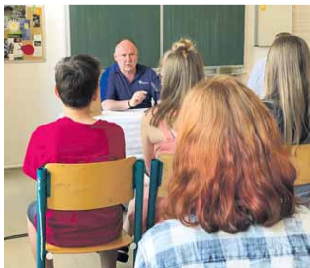
Hejtman na návštěvě Základní školy Javorník.

a zajímavých tipů, jak regionu pomoci,“ uvedl Okleštěk.