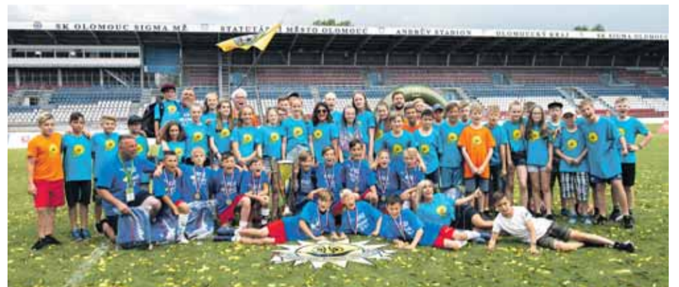
Šumperská ZŠ Sluneční se na Andrově stadionu v Olomouci raduje z celkového primátu v McDonald's Cupu.

Jeho šumperská škola se do republikového finále dostala poprvé v historii a rovnou svou šanci využila na sto procent. Kromě „ušatého“ poháru získala i hlavní cenu pro vítěze,