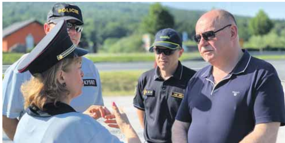
Třídenní cvičení u Mikulovic a Zlatých Hor na Jesenicku zaměstnalo přes 260 lidí.