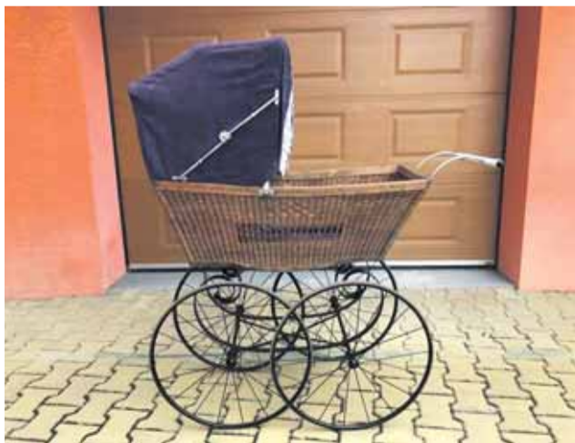
Přes 300 historických kočárků je k vidění v Plinkoutu na Olomoucku. Exponáty jsou staré 100 až 130 let.

Manželé Křístkoví společnými silami zachraňují jednotlivé poklady. Jak se jim to daří, můžete posoudit sami návštěvou muzea s takto unikátní sbírkou. Sezonně se bude expozice měnit, aby dostaly všechny kočárky možnost vystavení. Celková sbírka je daleko rozsáhlejší, mnoho kočárků ještě čeká na renovaci. „Není dne, abych si nevyžehlila alespoň zavinovačku,“ řekla spoluautorka výstavy, která svému koníčku věnuje veškerý volný čas. „Otevřením muzea jsem docílila svého snu, na kte-