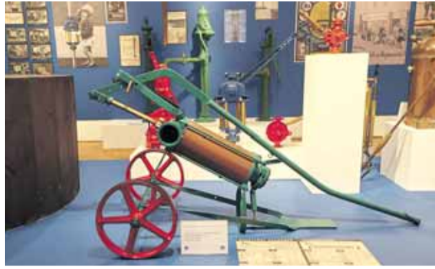
Výstava představuje příběh firmy od začátku lutínského pumpaře a studnaře Ludvíka Sigmunda až po dnešní velkou moderní společnost.

Výstava ukazuje artefakty spojené s jednotlivými etapami historie firmy, která