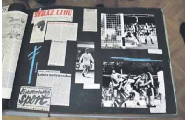
Současný druholigový klub dávat nahlédnout do svého 115 let starého zákulisí.

Všichni příznivci celosvětově nejoblíbenějšího sportu, ale současně i místní fandové a prostějovští patrioti mohou nahlédnout do historie fotbalu v Prostějově od období první republiky až do současnosti. Výstava představí jednotlivé kluby, které v Prostějově působily, nejvýraznější osobnosti, největší úspěchy klubu, ale také různé pikantnosti