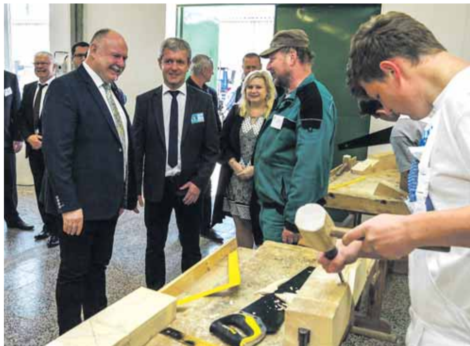
Dotace umožní pracovat žákům Švehlovy střední školy polytechnické na moderních strojích.

Při práci s novým nákladním automobilem získají žáci vzdělání, které jim umožní kvalifikovaný výkon při diagnostice a opravách aut. „Nově pořízený nákladák navíc poslouží k tomu, aby žáci měli možnost získat řídičské oprávnění skupin C a C +