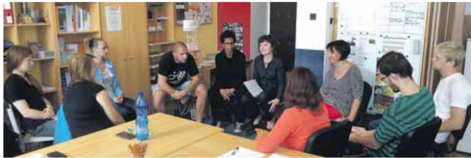
Účastníci projektu Začít znovu by se měli dlouhodobě uplatnit na pracovním trhu.

Mladí lidé do třiceti let, kterým se nedaří sehnat práci, mají šanci získat zkušenosti, se kterými lépe obstojí na trhu práce. Dvacet z nich navíc dostane možnost vydat se na osmítýdenní odbornou stáž do Španělska nebo do Skotska.