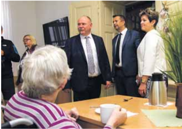
„Výjezdy do regionů jsou pro nás skvělou inspirací. Od lidí slyšíme, co by bylo třeba zlepšit,“ říká hejtmán Ladislav Okleštěk.

Na pravidelný výjezd do některého z regionů Olomouckého kraje vyrazili ve středu 22. května krajské radní. Tentokrát zvolili Přerovsko. Během dopoledního programu navštívili například cestmistrovství, domov pro seniory, školy, ornitologickou stanicí v Přerově a setkali se také s vedením magistrátu.