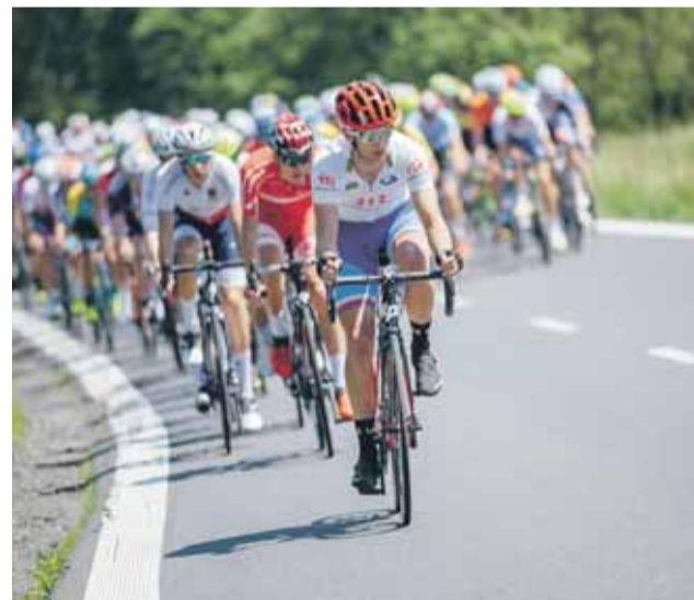
Sportovce, kteří mají tréninkové zázemí v Olomouckém kraji, podpoří hejtmánství částkou přes 2,5 miliónu korun.

Olomoucký kraj nakonec podpoří 108 žádostí mládežnických reprezentantů a 35 z dotačního titulu pro starší reprezentanty.