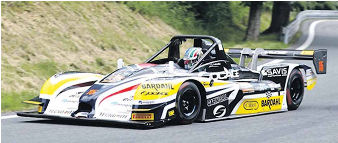
Simone Faggioli dojel letos v celkovém pořadí ve druhém nejlepší čas.