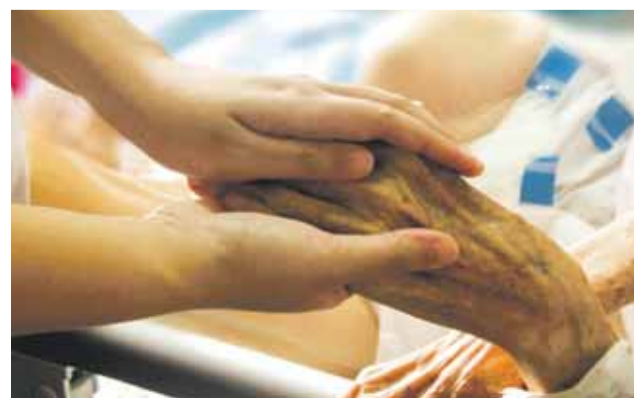
Kraj posílá peníze na lůžkovou i domácí péči o těžce nemocné a umírající lidi.

„Koncept rozvoje paliativní péče počítá s tím, že nově bude v každém okrese našeho kraje k dispozici alespoň jeden její poskytovatel,“ uvedl hejtmán Olomouckého kraje Ladislav Okleštěk. (red)