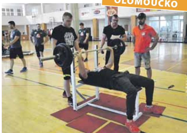
Bench press na rovné lavici s velkou činkou na dvanáctém ročníku Silácké Litovle Gustava Frištenského. V akci zástupce čtveřice Frištenský original team.

První místa nakonec obsadila družstva „Favál“. Mezi muži kvarteto Favál Gym Brno, mezi ženami celek Favál Rambo-team. Mimo hlavní soutěž se Marek Náhlík pustil do stanovení litovelského rekordu v počtu shybů na hrazdě. Za tři hodiny jich svedl 1 600.