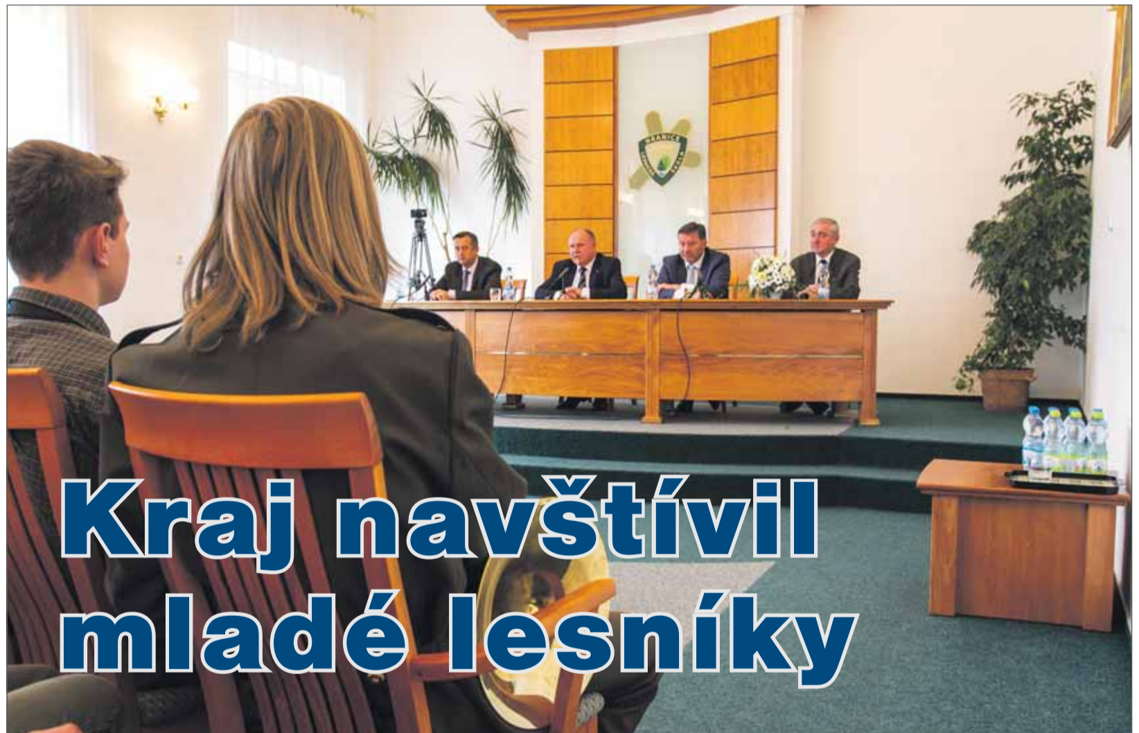
Ladislav Okleštěk hejtman Olomouckého kraje

Letos chystáme další modernizaci našich krajských škol, při které se zaměříme hlavně na zlepšení podmínek výuky studentů technických oborů. Hezké prostředí ale připravíme do září pro všechny. A spoléháme přitom na vás, naši ředitele.