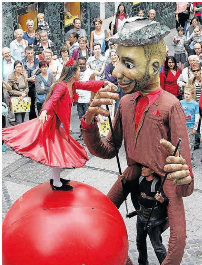
Top zážitkem v průvodu bude vystoupení „Compagnie with balls“, což obnáší taneční vystoupení na obřím balónu, se kterým si „pohrává“ velká loutka.

Zavítejte na oslavy 850 let Hranic a užijte si skvělý den. (nad)