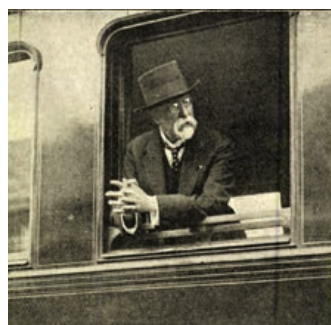
Odjezd prezidenta z hranického nádraží.

Poté se přesunul do vojenské akademie. Před ní čekal opět dav lidí. Nad průvodem prováděla leteckou show eskadra letců