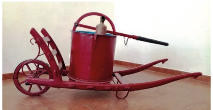
Ruční trakařová stříkačka.