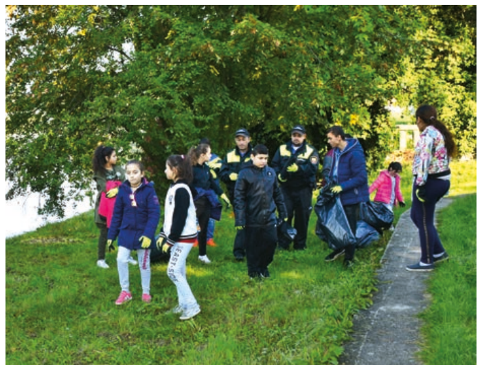
Asistenti prevence kriminality organizují například úklid města romskými dětmi.

Asistent prevence kriminality není strážníkem ani čekatelem, ale plní úkoly, které nejsou dle zákona o obecní policii svěřeny výhradně strážníkům nebo čekatelům. Při své činnosti jsou asistenti podřízeni konkrétnímu strážníkovi (mentorovi), který komplexně garantuje jeho činnost od vedení, podpory až po vystrojení. (bak)