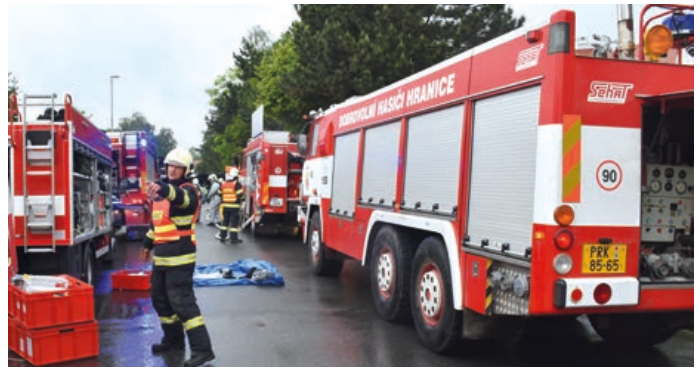
Profesionálové i hraničtí dobrovolní hasiči spolu trénují i vážné zásahy. Tento snímek je z loňského nácvičku likvidace převrácené cisterny s nebezpečnou látkou.

Šíře zásahů je takřka totožná s profesionály, od požárů přes technické zásahy až po dopravní nehody, a to v celé oblasti obce s rozšířenou působností Hranice. I proto mají vybavení prakticky totožné s profesionálními hasiči. Od června letošního roku jejich vybavení vylepší i nová cisternová automobilová stříkačka Scania. Dosud se museli spokojit se zastaralou cisternovou automobilovou stříkačkou Tatra z roku 1989. Projekt „Hranice - Cisternová automobilní stříkačka“ je spolufinancován z Olomouckého