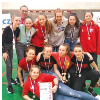
Mistryně republiky z Hranic.

Ve finále jsme opět narazily na favorizované hráčky z Mladé Boleslavi. Tyto hráčky vyhrávaly hravě svá utkání, včetně prvního zápasu s námi, a tak se předčasně