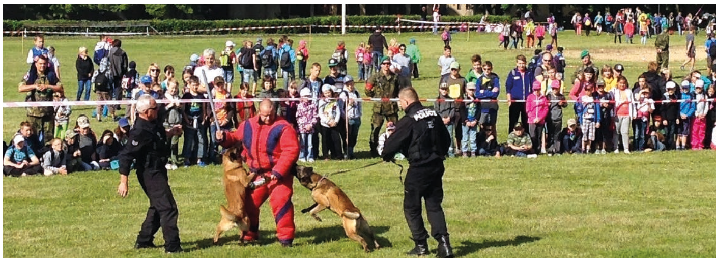
Hranické hry bez hranic – Bezpečné město. Městská policie předvádí činnost služebních psů.

Důležitou část práce Městské policie Hranice i Obvodního oddělení Policie ČR v Hranicích zahrnuje preventivní přednášková činnost na hranických školách.