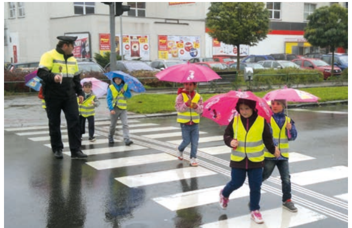
Strážníci městské policie pomáhají dětem na přechodech pro chodce.

Městská policie také dohlíží na dodržování obecně závazných vyhlášek města a nařízení měs-