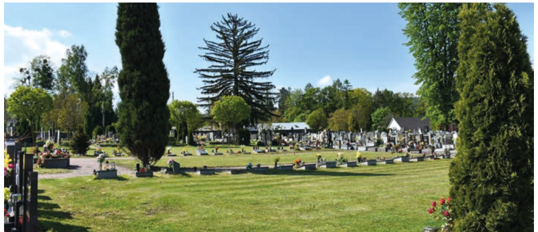
V tomto prostoru se chystá vybudování epitafních desek a posypové loučky.

Kanalizace povede od vstupu na hřbitov až k řece Ludině. Akce to nebude jednoduchá, protože v ulici vede velké množství inženýrských sítí, což může přinést značné komplikace. Na tuto část je v rozpočtu vyčleněno 12 milionů korun. Mimo budování kanalizace se také upraví zpevněné plochy v ulici Hřbitovní a po pravé straně bude upraveno devět parkovacích míst.