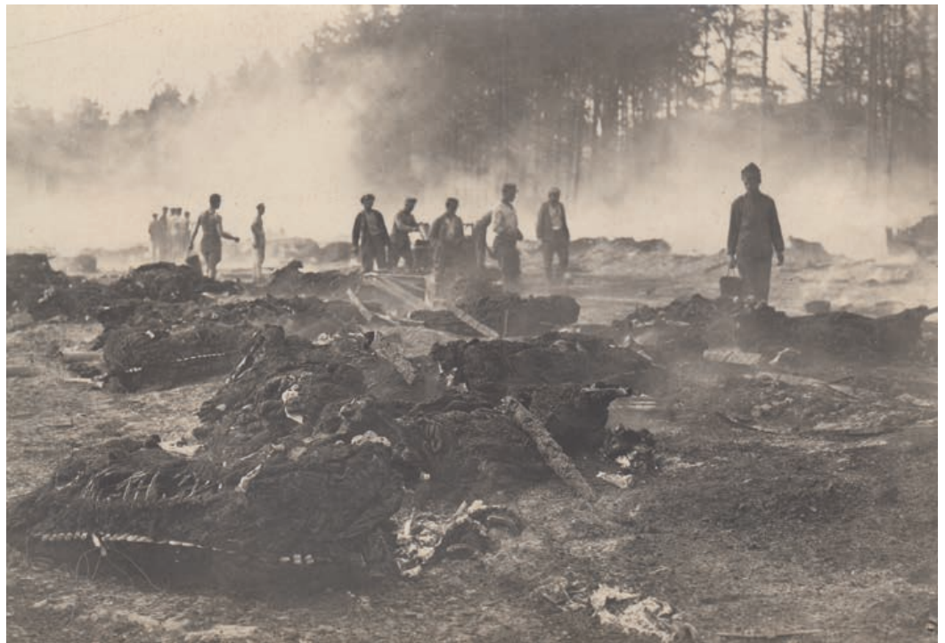
Při požáru ve vojenské akademii 12. srpna 1921 uhořelo 93 koní a škoda činila 4 miliony korun.

blízko něho byl nesnesitelný. Hasič Hubka měl popálené obě ruce.