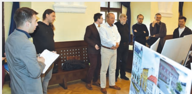
Odborná porota posuzuje předložené návrhy.