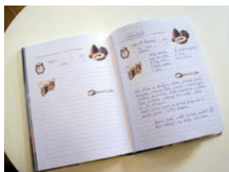
Hranická originální kuchařka se už plní rodinnými recepty obyvatel Hranic.

Zatím kuchařku nepůjčujeme domů, proto si doneste svůj recept napsaný s sebou a v knihov-