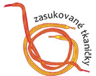
Sbírku Zasukované tkaničky i letos v Olomouci doprovodí dvoudenní kulturní program.

„Jako vždy je hlavním posláním sbírky získat finanční prostředky na dofinancování služeb osobní asistence pro lidi s těžkým zdravotním hendikepem, ale i na pomoc při zapůjčení kompenzačních pomůcek, invalidních vozíků a na bezplatné