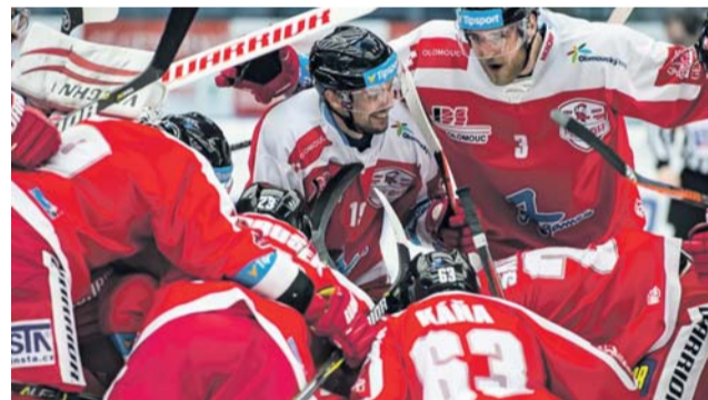
Radující se hokejisté Olomouce. Plzeň ve čtvrtfinále play-off pořádně potrápili.

Druhý úspěch v řadě na vlastním ledě ale Hanáci nepřidali. Plzeň si nenechala vzít vedení a odjížděla s výsledkem 2:3 a vyrovnanou sérii.