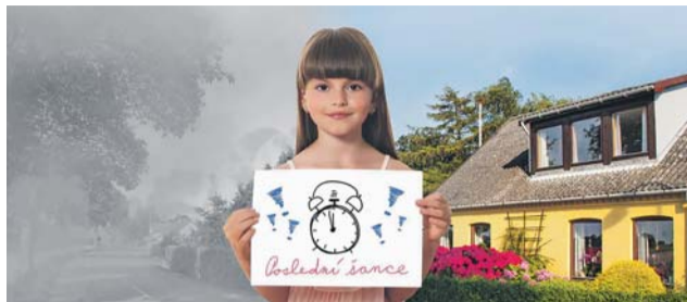
Letos startující třetí vlna kotlíkových dotací je poslední příležitostí požádat si o příspěvek na výměnu starých kotlů na pevná paliva, která budou muset domácnosti za tři roky vyřadit z provozu.

Na konci března tak krajský úřad vyhlásil poskytování podpory majitelům rodinných domů, kteří potřebují modernizovat vytápění. Žádost mohou lidé podávat prostřednictvím elektronické evidence od 4. června na webových stránkách kraje. Evidence bude přístupná od 10 hodin. Papírovou podobu žádosti s přílohami pak stačí do deseti pracovních dní donést na krajský úřad.