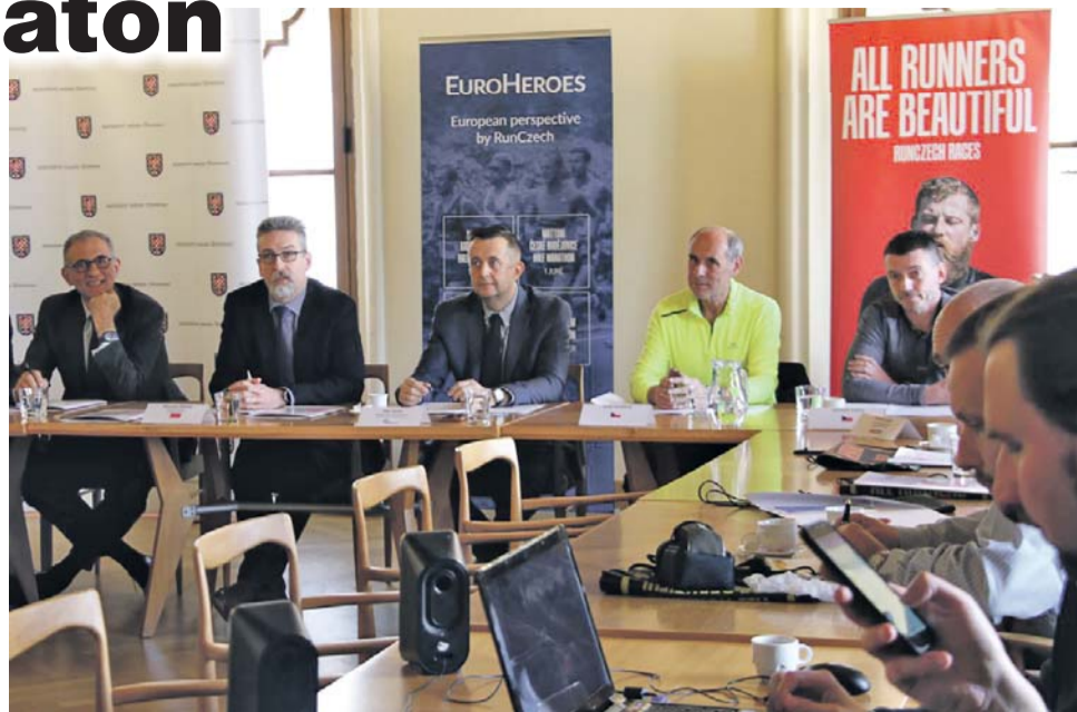
Olomoucký závod je držitelem prestižní zlaté známky IAAF.

Zhruba jednadvačt kilometrů dlouhou trasu v barokních kulisách krajského města si ani letos nenechají ujít vytrvalci a hvězdy světové atletiky.