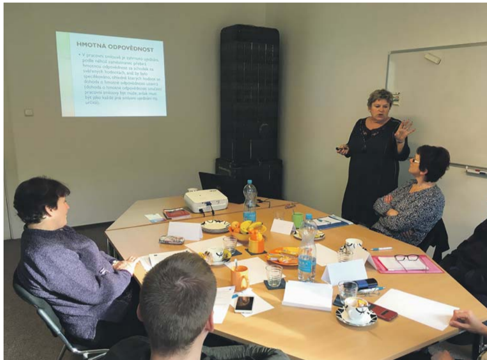
Každý účastník projektu First Job absolvuje rekvalifikační nebo kvalifikační kurz a měsíční odbornou placenou stáž.

V rámci projektu je pro uchazeče připraven motiváční program zaměřený na aktuální informace z trhu práce, pracovní právní vztahy s příklady z praxe a na praktické rady z oblasti sebezprezen-