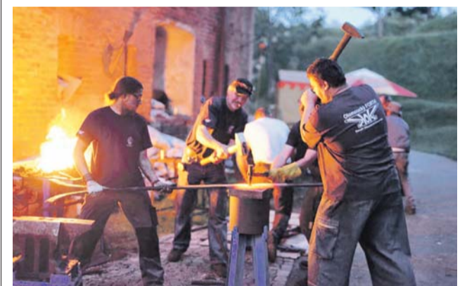
Na kovářském setkání budou mít návštěvníci možnost vyzkoušet si práci se žhavým železem.

Už potřetí se letos rozezní úder kovářských kladiv na fortu v Křelově nedaleko Olomouce. Akce Olomoucký FORTel přivítá o víkend 17. až 19. května třicetku kovářů, z nichž mnozí patří k evropské i světové špičce v oboru. Kromě mistrů z České republiky přislíbili účast i kováři z Itálie Slovenska, Maďarska a Ruska. „Budou pracovat na společném velkém díle a na svých drobnějších pracích. Jedna kovářská dílna bude vyhrazena i pro návštěvníky. Ti si budou moci pod vedením kovářského mistra vyzkoušet práci se žhavým železem,“ popsal hlavní náplň setkání předseda spolku Kováři Olo-