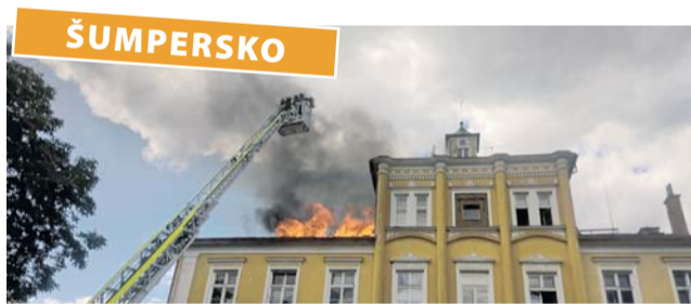
Lidé na Šumperku doufají, že požár na počátku loňského léta byl poslední temnou skvrnou v historii Zámečku Třemešek.

Zámeček Třemešek, který byl v minulosti jedním z kulturně-společenských a politických center šumperského se po desetiletích opět probouzí. Místo, které naposledy sloužilo jako internát a dílny šumperské učnovky a poté jako sociální ubytovna získala v roce 2010 za symbolickou korunu od Olomouckého kraje obec Dolní Studénky.