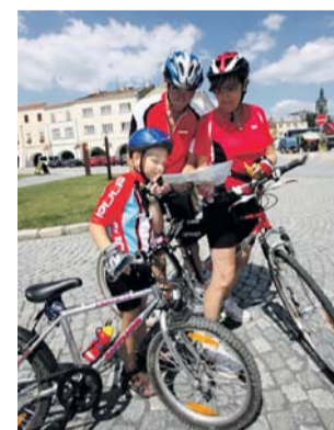
S podporou hejtmánství se letos začnou stavět cyklostezky v osmi obcích.

„O dotaci na rekonstrukci přechodů pro chodce, míst pro přecházení, autobusových zastávek a na výstavbu i opravy chodníků byl mezi obcemi a městy