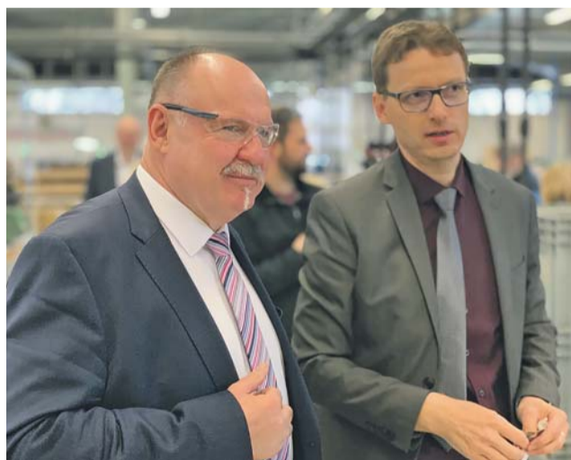
Ve stejný den, kdy hejtmán na náměstí ve Šternberku zaparkoval svou mobilní kancelář, se ráno členové Rady Olomouckého kraje setkali s podnikateli. Na snímku návštěva firmy Robertshaw.