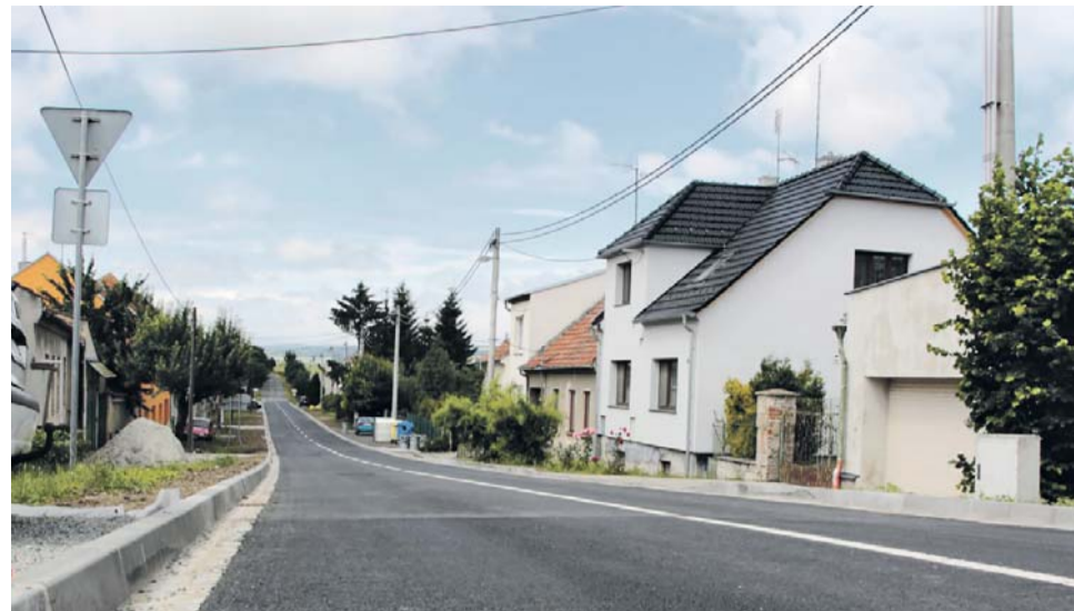
Na obnovu venkova letos kraj připravil 62 miliónů korun.

Zájem vesnic o krajskou podporu je obrovský. Některé obce dokonce žádají peníze ze všech pěti dotačních titulů, které program zahrnuje.