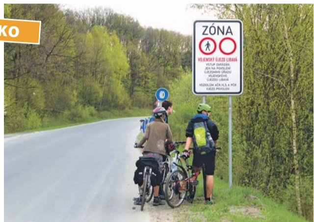
Cyklisté, kteří 1. května zamíří na akci Bílý kámen, nesmějí zapomenout na přilbu.

České dráhy i letos vypraví dva posilové vlakové spoje se zvýšenou kapacitou přepravy kol. Tyto vlaky zastavují na zastávkách Olomouc hl. n., Velká Bys-